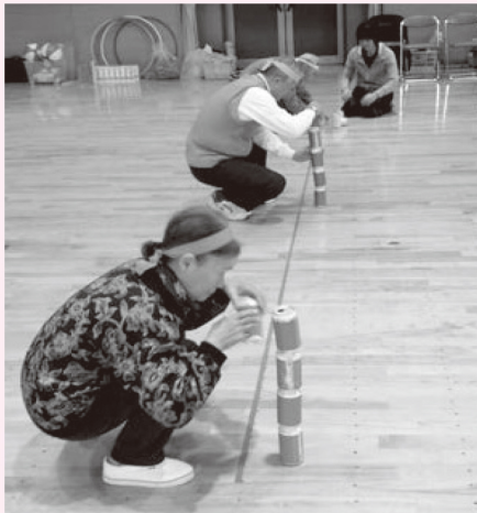
恒例の缶積み競争では真剣勝負