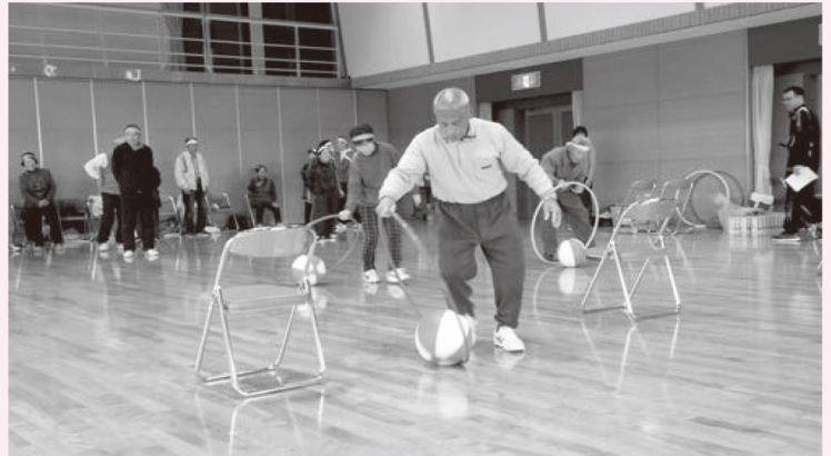
赤・青・黄色団に分かれてボール運び競争