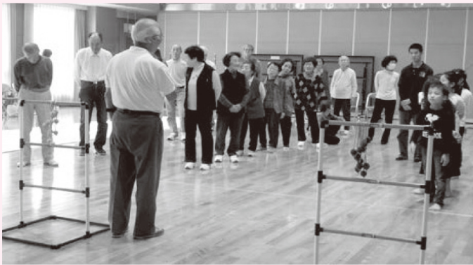
学童の子供たちも参加して、ラダーゲッターやシャッフルボードを楽しみました。