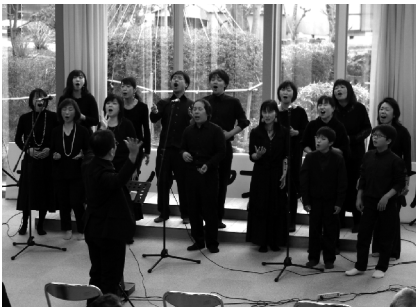
T-GRACE CHOIRさんのゴスペルでOPEN！