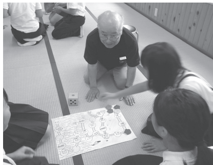
☆いきいきふれあいサロン☆ 小学生との交流プログラム