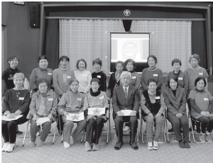
☆百歳体操交流会☆ 継続グループの表彰