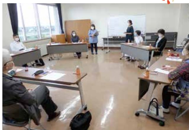
感染症に気をつけながらの集いの場を考える