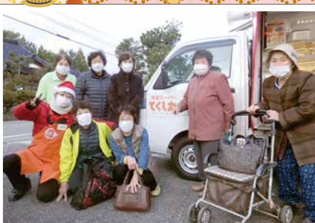
移動スーパー「とくし丸」を囲む 東芦原