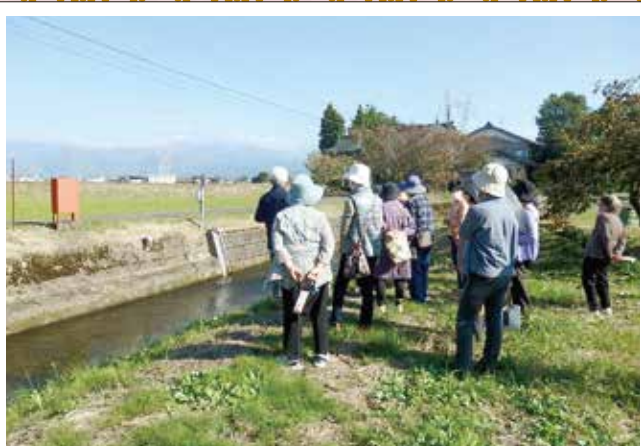
「防災さんぽ」海老江・竹鼻いきいきサロン