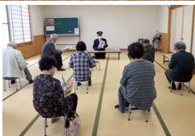
「防犯教室」国重いきいきふれあいサロン

コロナ禍の今だからこそ、地域の方とのつながりを大切にしたいですね。 感染症予防をしながら、人と人との交流を！お互いに無理のないところで地域の絆を つないでいきましょう。本年も舟橋村社会福祉協議会をよろしくお願いいたします。