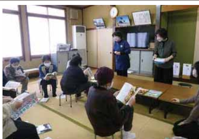
図書館による出前お話し会 東芦原さわやかサロン

コロナがまだまだ終息したわけではないですが、社協や地域では工夫しながら、事業やサロンを実施し、人と人との交流を広げています。本年も舟橋村社会福祉協議会をよろしくお願いいたします。