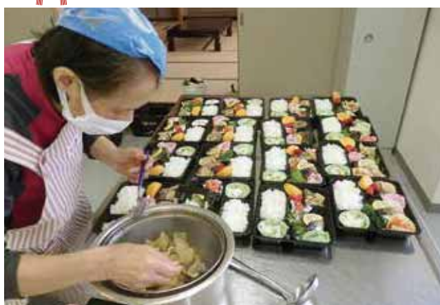
たべんまいけのお弁当を盛り付けています！