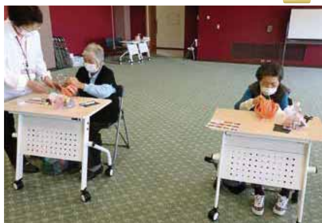
すまいる広場での工作づくり