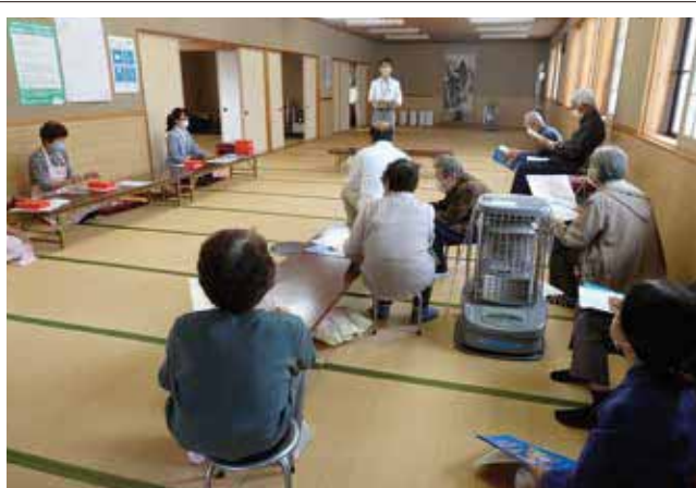
「防災のお話」仏生寺にここサロン