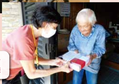
民生委員よりお祝い品を 受け取られる敬老会員様