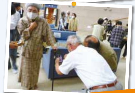
認知症高齢者役として、ふなはし荘のケアマネさんにもご協力いただきました。