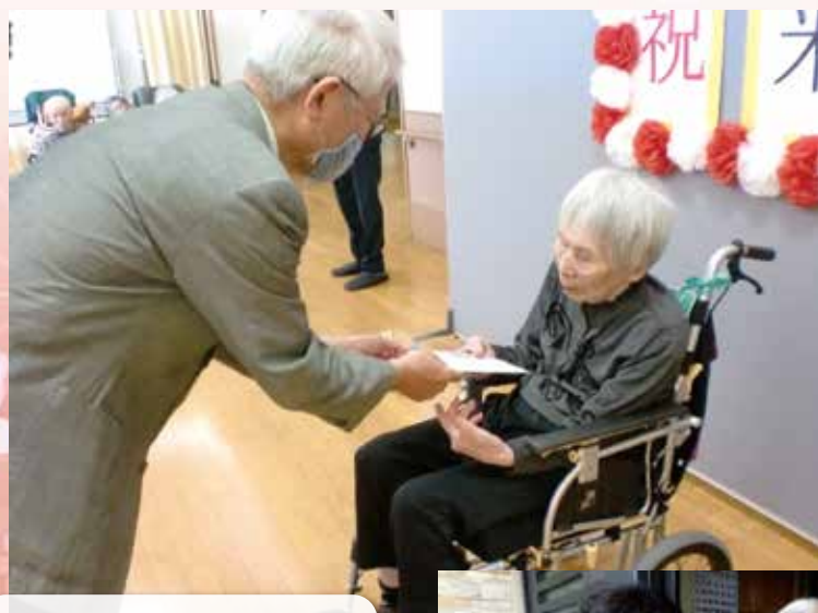
ふなはし荘にてお祝い品を 受け取られる利用者様