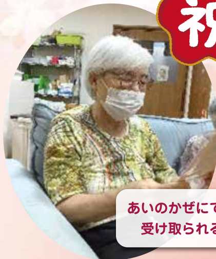
あいのかぜにてお祝い品を 受け取られる利用者様