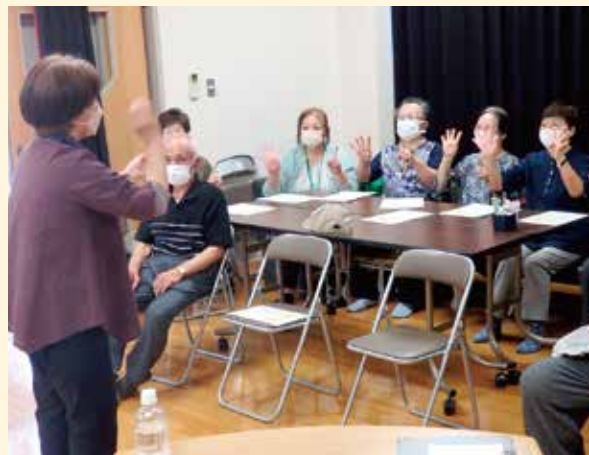
図書館、サポーターさんの協力もあり、楽しい時間を過ごしました。