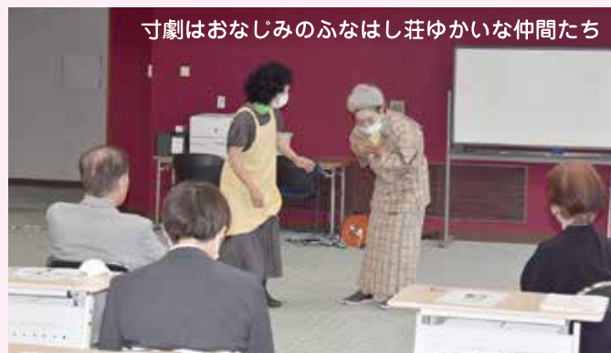
寸劇はおなじみのふなはし荘ゆかいな仲間たち

「認知症サポーター」は認知症について正しく理解し、偏見を持たず認知症の人や家族を温かく見守る「応援者」です。