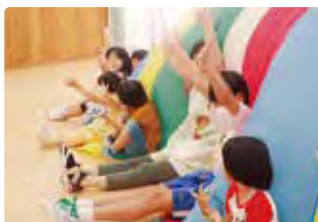
みんなと運動会の練習中！