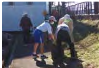
いつも使う駅をきれいに！