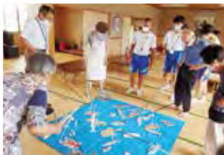
レクリエーションのお手伝い

今年度の夏休みふれあいボランティア体験は、数年ぶりに本格的な開催となり、小学生の希望者延べ6名、中学生の希望者延べ55名が参加しました。（実施期間：7月27日～8月25日）