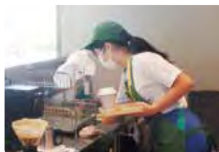
初めてのカフェ体験