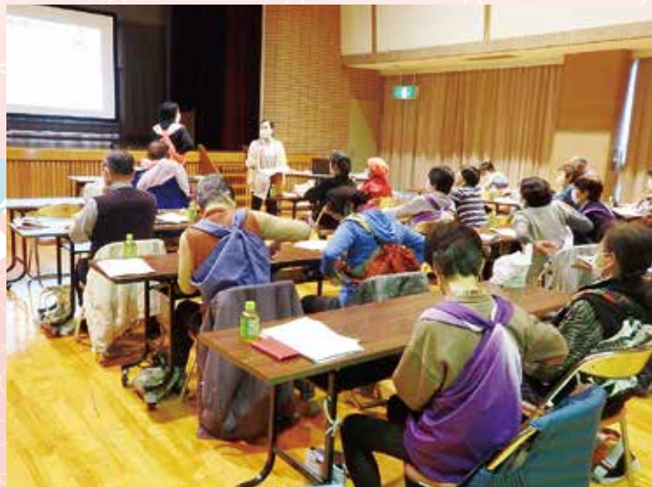
ふろしきでリュックづくり!

11月28日(火)舟橋会館ホールにて、『災害への備え～自分の地域で考えよう～』というテーマで防災講座が開催されました。