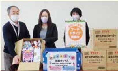
○富山市 明治安田生命 富山駅前営業所 様 食品 計 63 品

村内外の企業、個人の皆さまよりご寄付を頂きました。心温まる善意に感謝いたします。