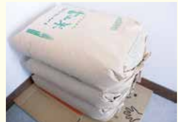
○舟橋村竹鼻 匿名 米 90 kg