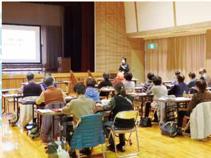
災害時の「共助」の大切さをお話されていました