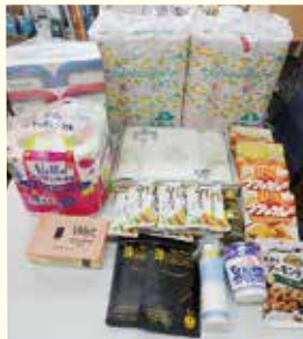
○富山市 CLEAN HERO 様 食品、日用品 計 58 品