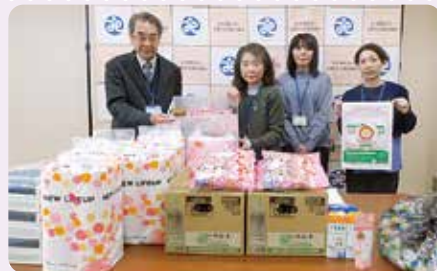
(株)ホクデン様より

いただいた食糧品や日用品は、村内の必要とされている方や福祉団体にお渡しさせていただきます。温かいご支援を賜りましたこと、心より感謝申し上げます。