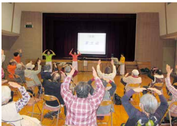
皆で楽しく身体を動かしました