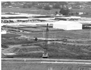
汚染土を詰めた黒い袋が延々と並ぶ