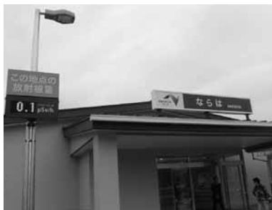
放射線量表示がされる楢葉町

過疎が進み高齢化率58%の昭和村や金山町の取り組みを伺い、心のこもった郷土料理のおもてなしを受けて、何とも言えない温かな気持ちで帰路につきました。