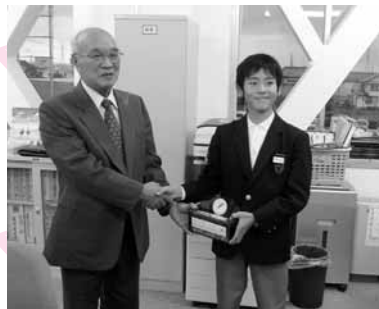
中学校生徒会からの募金