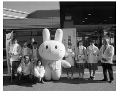
中学生と着ぐるみハーティちゃん