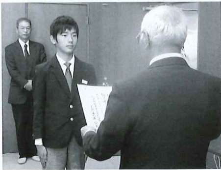
舟橋中学校への感謝状

集められた募金は、募金を頂いた地域で使われています。また一部は災害準備積立金等に使われます。