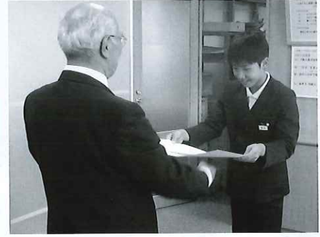
舟橋村小学校への感謝状

集められた募金は、募金を頂いた地域で使われています。また一部は災害準備積立金等に使われます。