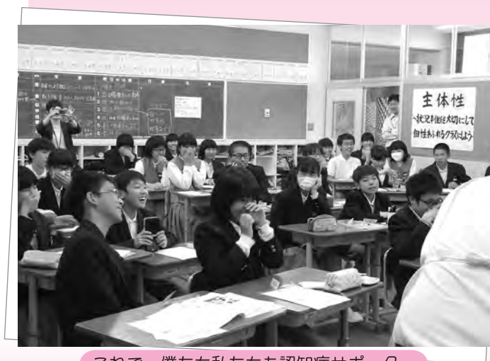
これで、僕たち私たちも認知症サポーター

認知症に関する正しい知識を持ち、認知症の人や家族を温かく見守るサポーター養成講座を舟橋中学校で開きました。講義を受けた2年生は、講義やDVD、寸劇を見ながら、認知症について真剣に学んでいました。