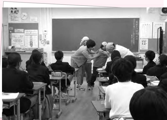
「ふなはし荘とゆかいな仲間たち」の熱演