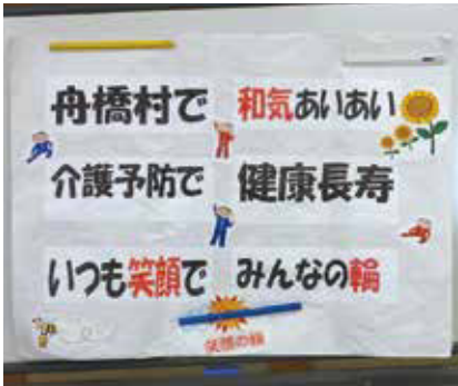
《介護予防事業の推進》