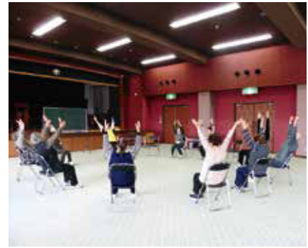
《地域包括支援センター》