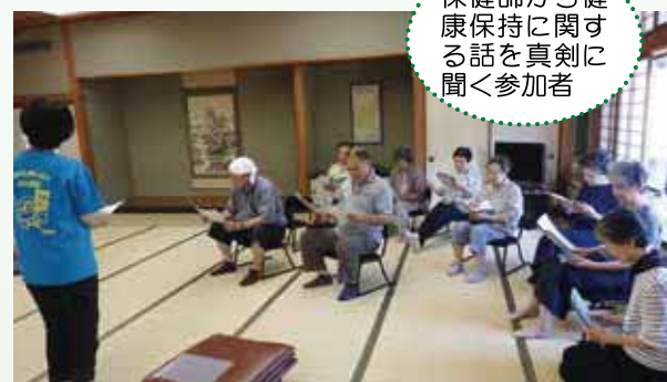
保健師から健康保持に関する話を真剣に聞く参加者