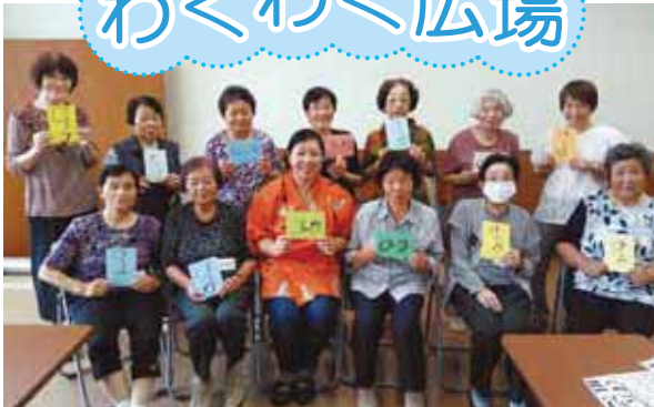
9月は書道を通じて脳トレしました。