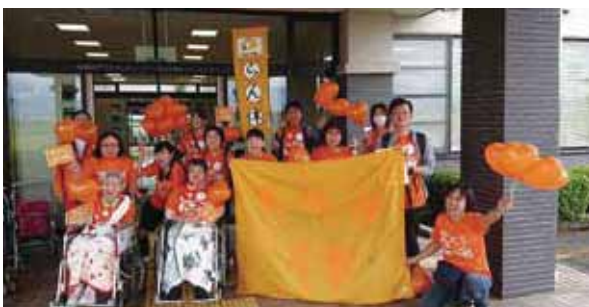
認知症を理解し、伴走する全国規模のイベントが9月21日に舟橋でも行われました。