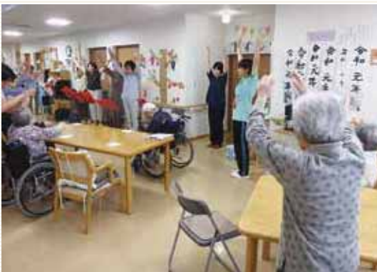
9月13日、ケアホームあいの風にて