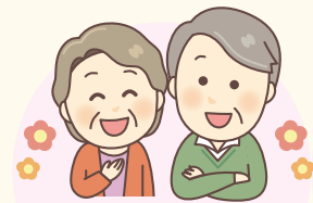
各地区 いきいきサロンへの助成