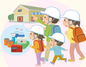
災害にそなえての準備積立