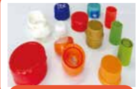
対象外のキャップです

ご協力いただくお一人お一人のお心遣いで、作業が大変スムーズに行えますので、上記のお願いにご配慮いただき、今後ともペットボトルキャップの回収にご協力をお願いいたします。