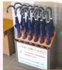
置き傘設置事業 (舟橋駅・舟橋会館)