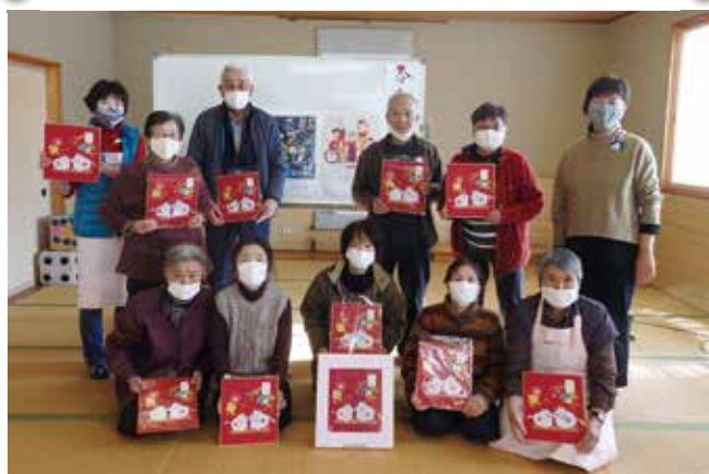
仏生寺地区 にこにこサロン