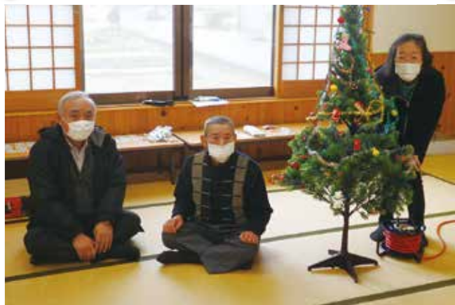
国重地区 ふれあいいいきサロン