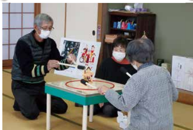
舟橋地区 なかよしクラブ