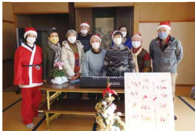
東芦原団地エリア パンプキンの会