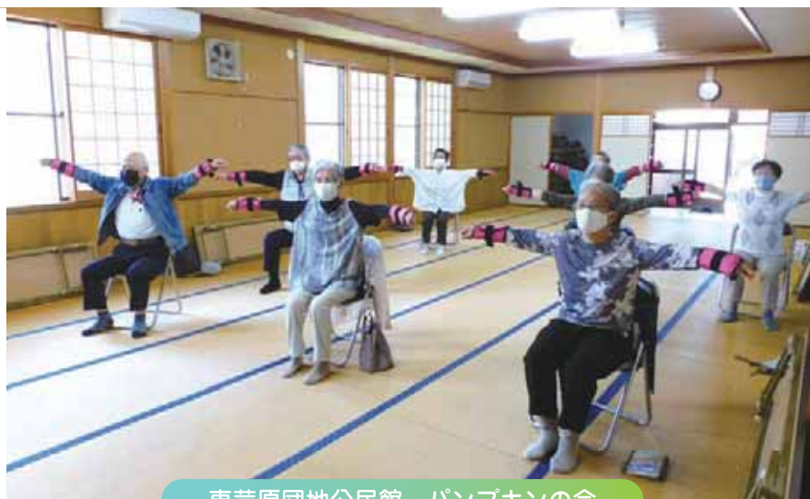
東芦原団地公民館 パンプキンの会