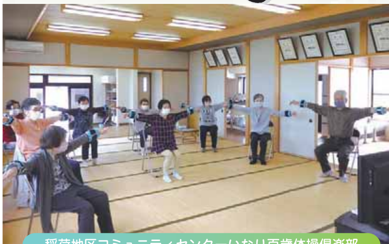
稲荷地区コミュニティセンターいなり百歳体操倶楽部