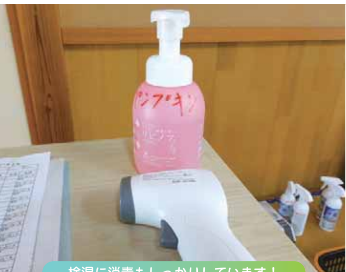
検温に消毒もしっかりしています!