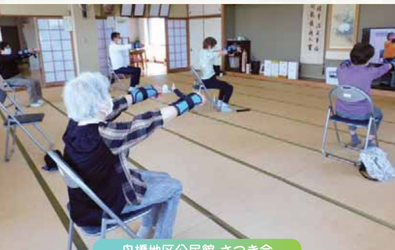
舟橋地区公民館 さつき会