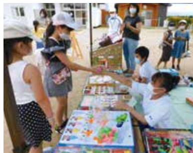
駄菓子屋さくらんぼで販売のお手伝い