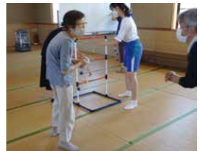
サロンではレクリエーションのお手伝いをしました。