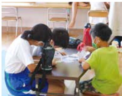
学童保育で子供たちとトランプ遊び!