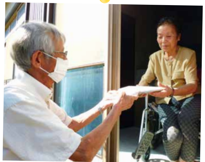
民生委員よりお祝い品を受け取られる 敬老会員様

今年度も、コロナウイルス感染予防の観点から、敬老会は中止となり、敬老の日前後に、自治会長さんや民生委員さんのご協力のもと、敬老会員の皆様にお祝いの品と村長、社協会長、小学生からのメッセージをお届けしました。コロナ禍で集まることは叶いませんでしたが、皆様にお祝いの気持ちを伝えることができました。敬老会員の皆様、これからも元気で長生きしてくださいね！自治会長さん、民生委員さん、施設の職員の皆様、ご協力ありがとうございました！