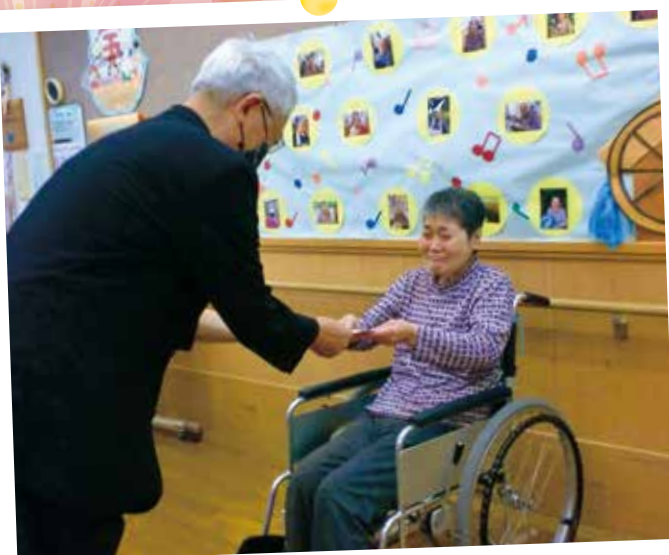
ふなはし荘にてお祝い品を受け取られる 利用者様